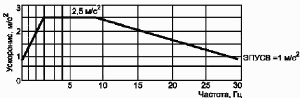
Рисунок 1 — Зависимость между максимальной амплитудой ускорения и частотой синусоидальной вибрации (спектр воздействия) для горизонтального направления 9 баллов в соответствии с [1] или [2] при нулевой отметке

(Продолжение изменения № 1 к ГОСТ 30546.1—98)