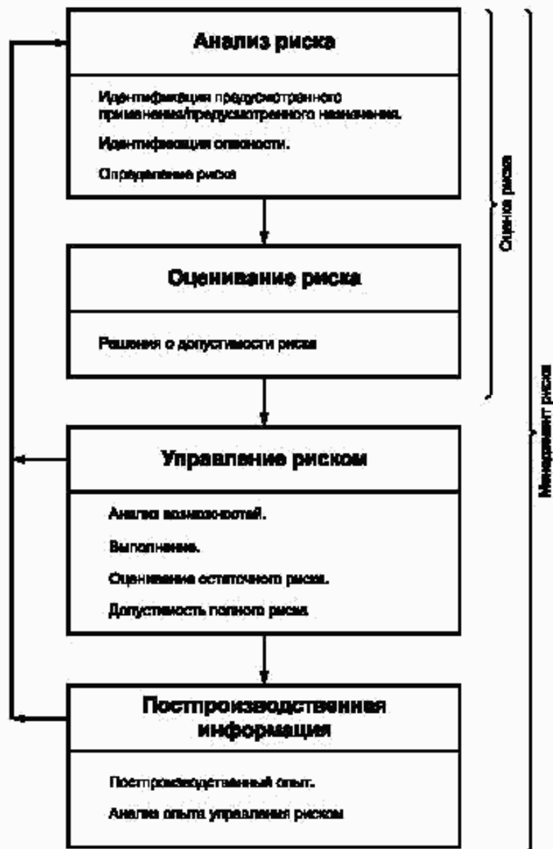
Рисунок 1 — Схема процесса менеджмента риска

Соответствие настоящему пункту проверяют контролем файла менеджмента риска.