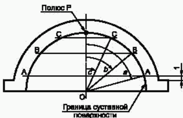
Рисунок А.2 — Расположение точек, измеряемых на вертлужной впадине