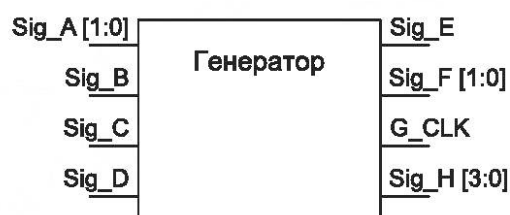
Рисунок 1 — Пример выполнения упрощенной схемы СФ-блока

5.3.4.1 Допускается приводить упрощенную схему, иллюстрирующую только интерфейсы СФ-блока и не раскрывающую его структуру, в соответствии с рисунком 1.