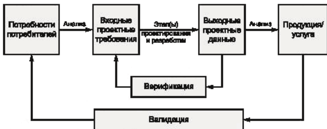
Рисунок 3 — Упрощенная схема взаимосвязи между верификацией и валидацией в процессе проектирования и разработки

Анализ может выполняться на разных стадиях процесса.